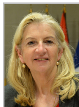
Pia Imbs Présidente de l'Eurométropole de Strasbourg