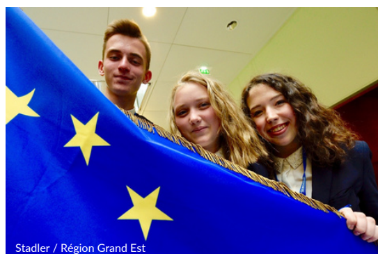
Stadler / Région Grand Est