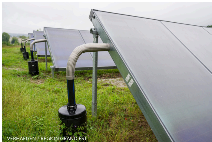
VERHAEGEN / RÉGION GRAND EST